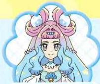
きゅあらめーる キュアラメール

あつい ところを もつ、じぶんの きもちに かっこいい おねえさん。すなおな せいかく。