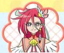
きゅあふらみんご キュアフラミンゴ

あつい ところを もつ、じぶんの きもちに かっこいい おねえさん。すなおな せいかく。