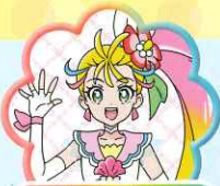
きゅあまー キュアママ