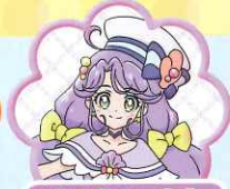
きゅあこーらる キュアコーラル