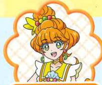
きゅあばいあ キュアババイア